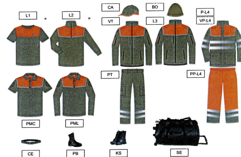
Illustration 1 : pièces d'équipement de la tenue PCi VD 15

La nouvelle tenue PCi VD 15 est conçue selon un système de couches. Elle comprend les pièces d'équipement suivantes :